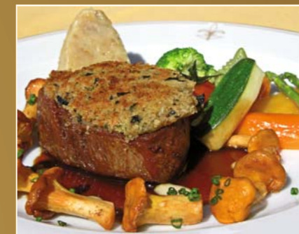
Medaillons vom Kalbsfilet unter der Pinien-schmelze, mit Pfifferlingen, Portweinjus, Marktgemüse, gebratenen Serviettenknödel und Schalottenkompott

seine erfolgreiche Laufbahn. Beispielweise die Romantik Hotels »Alte Post« in Wangen im Allgäu und »Fürstenhof« in Landshut, das Alpenhotel Krone in Pfronten, das Hotel Maximilian in Oberammergau oder der Engelkeller in Memmingen, um nur einige zu nennen.