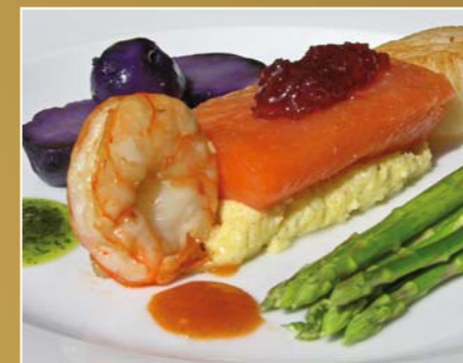
Trilogie von Meeresfrüchten: Lachs, Garnele, Jacobsmuschel mit Vanille-Polentapüree, lila Kartoffeln, grünem Spargel und roter Tomatenmarmelade