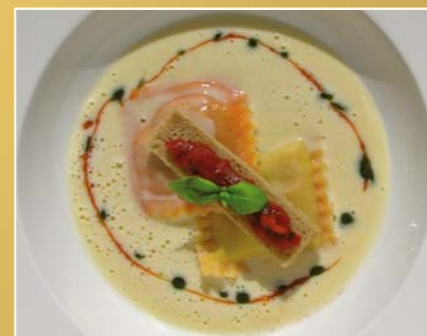
Weißer Tomatensuppe mit Tomaten-Mozzarella-Ravioli, Tomaten-Croustini und Petersilienperle

zeichnungen, hatte er von 1995 bis 1998 einen festen Platz als Sternekoch und über zehn Jahre lang honorierte der Gault Millau seine kreative Kochkunst mit drei Hauben und 17 Punkten. Schloss Lautrach wurde 2008 unter seiner Leitung als bestes Tagungshotel Deutschlands ausgezeichnet. Weitere erstklassige Stationen prägten